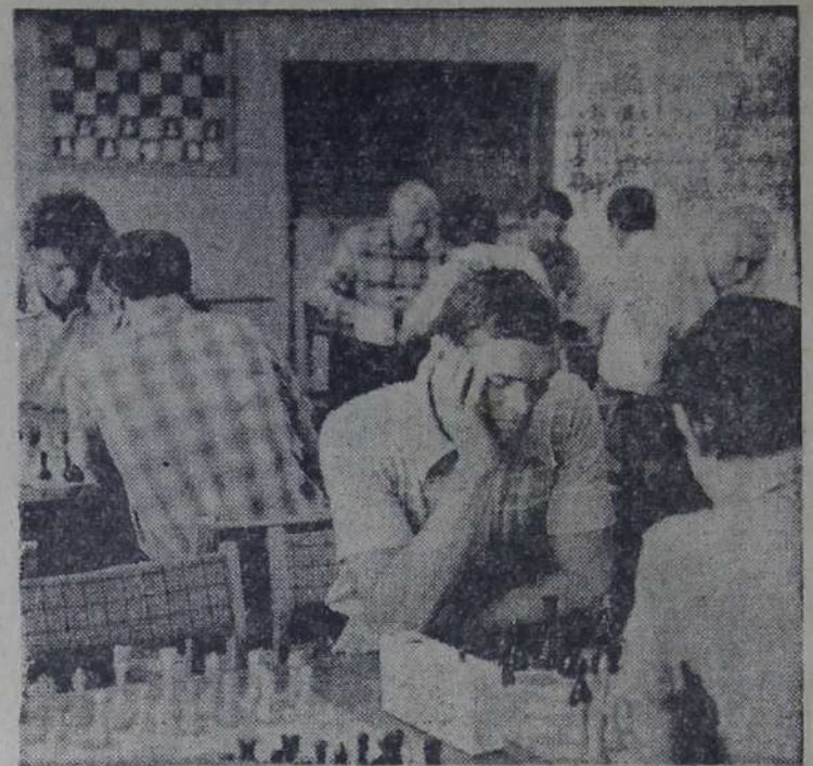
В шахматном клубе производственного объединения «Балаковорезинотехника» часто проходят различные соревнования. НА СНИМКЕ: идет блитурнир.