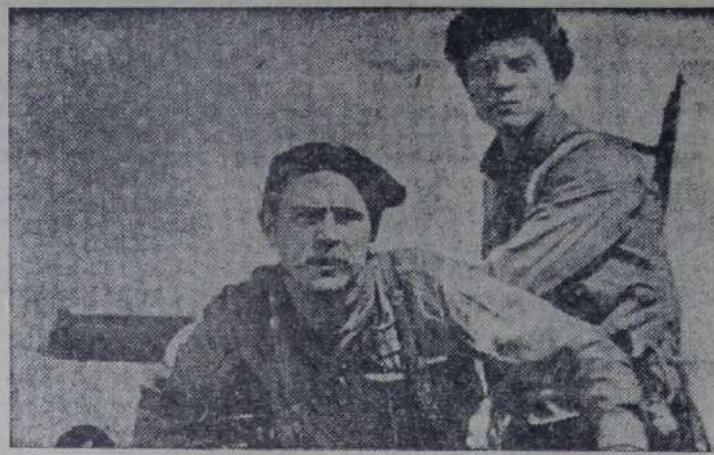
18 января — 80 лет со дня рождения Б. А. Бабочкина (1904 — 1975 гг.)