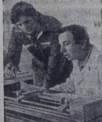
На снимках: наземные установки нового хранилища газа; у пульта управления и контроля.

Новый комплекс будет аккумулировать в летние месяцы сотни миллионов кубических метров природного топли-