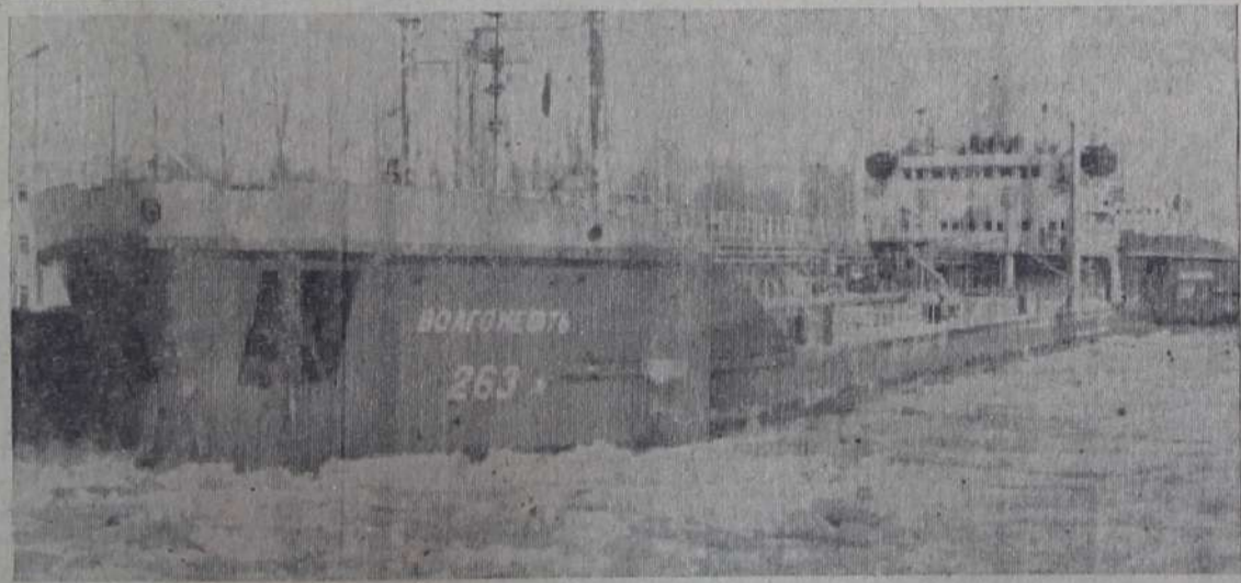
НА СНИМКЕ: производится шлюзование сверху вниз танкеров «Волго-нефть-263» и «Волго-нефть-261».