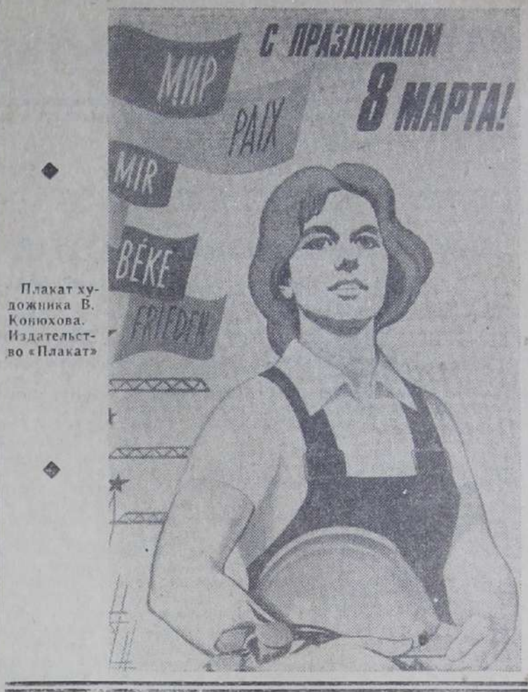
Плакат художника В. Ковюхова. Издательство «Плакат»

Горком КПСС. Исполком городского Совета.