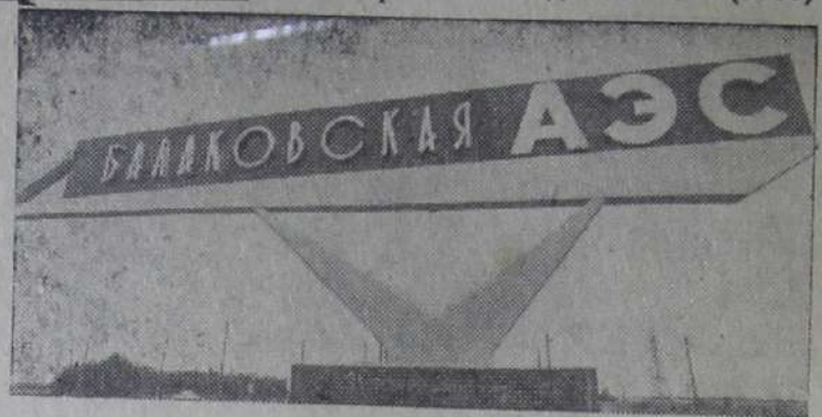
САРАТОВСКАЯ ОБЛАСТЬ. Напряженные дни сейчас у строителей Балаковской атомной электростанции. Ввод в действие ее мощностей предусмотрен решениями XXVI съезда КПСС. Планируется пустить в нынешней, одиннадцатой пятилетке энергоблок-миллионник. Сегодня строители ордена Ленина управления «Саратовгэстроя» ведут работы в первом реакторном отделении.

В. САБАНОВ, токарь завода самоходных землеройных машин, член горкома КПСС.