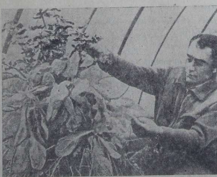
ВНР. Рациональный способ выращивания овощей: вешеные в теплице, позволяющий сэкономить полезную площадь, энергосэконо-

шем году свой «серебряный юбилей», как бы перекидывает мост между Новым и Старым Дели. Осуществляя генеральный план застройки Дели, управление играет важную роль в решении жилищной проблемы. За годы его деятельности на окраинах столицы появилось более десятка новых благоустроенных районов, в которых поселились сотни тысяч делийцев. Только в завершившемся в марте 1982/83 финансовом году новоселье справили 25 тысяч человек. Первое, что бросается в глаза в этом огромном городе, — обши-