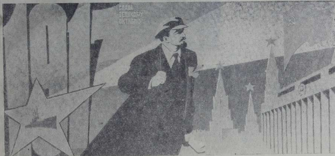
Плакат художника В. Сачкова «Слава Великому Октябрю!».