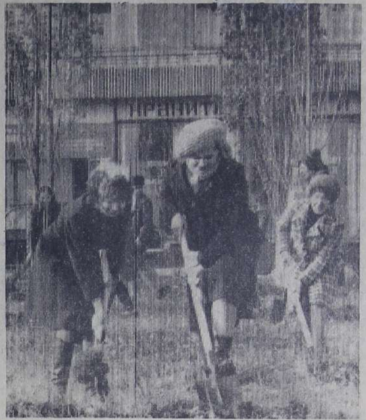
Активно прошел городской субботник. В нем приняли участие промышленные предприятия, организации, жилищно-коммунальные службы, жители города.

НА СНИМКЕ: работники центральной городской сберегательной кассы на уборке территории.