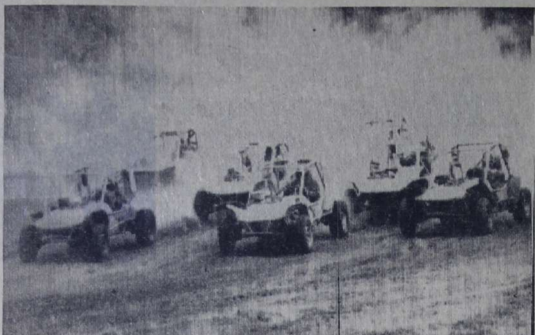
На трассе — спортивные автомобили «багги».