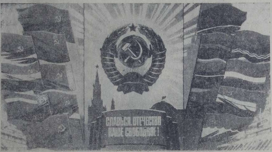
Плакат художника В. Викторова.

№ 161 (9701) Пятница, 7 октября 1983 года Выходит четыре раза в неделю Цена 2 коп.