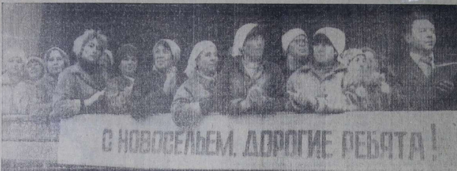
Как уже сообщалось в нашей газете, первого сентября строители торжественно вручили ключ от новой школы № 23 ее хозяевам. В числе приглашенных гостей были и труженники с участка отделочных работ, принимавшие участие в строительстве школы. НА СНИМКАХ: лучшие отделочники участка; первый звонок.