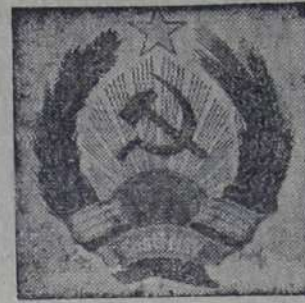
Герб Эстонской ССР.