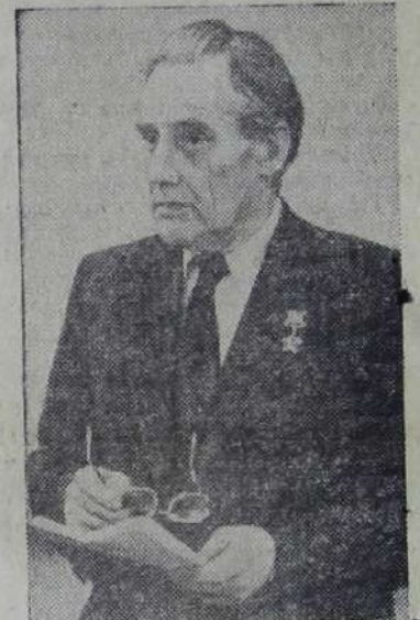
Мери — депутат Верховного Совета Эстонской ССР, председатель Президиума Эстонского общества дружбы и культурных связей с зарубежными странами.

В ВЕЛИКОЙ Отечественной войне первым из эстонцев был удостоен звания Героя Советского Союза Арнольд Мери. В то время он был заместителем политрука роты. Сейчас А.