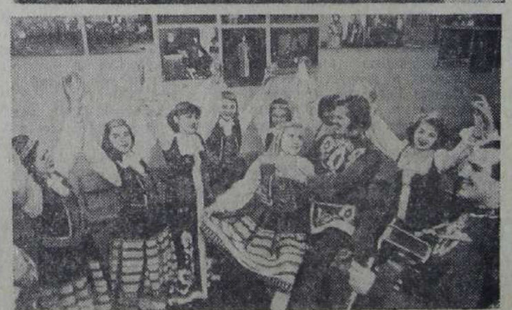
Большая дружба связывает трудящихся эстонского города Нарва с Ивангородом Ленинградской области.