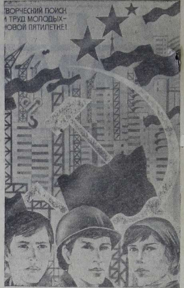
Планат художника Л. Петрушина «Творческий поиск и труд молодых — новая пятилетка!». Издательство «Планат».