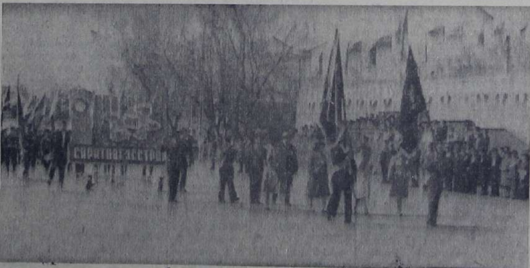
Праздничная демонстрация в Балакове.

В адрес машиностроительного завода им. Дзержинского поступила правительственная телеграмма. Руководство Министерства поздравило лауреатов премии Совета Министров СССР 1982 года с праздником 1 Мая и пожелало больших творческих успехов, в первую очередь, в создании дизель-генераторов к новым тепловозам и буровым установкам.