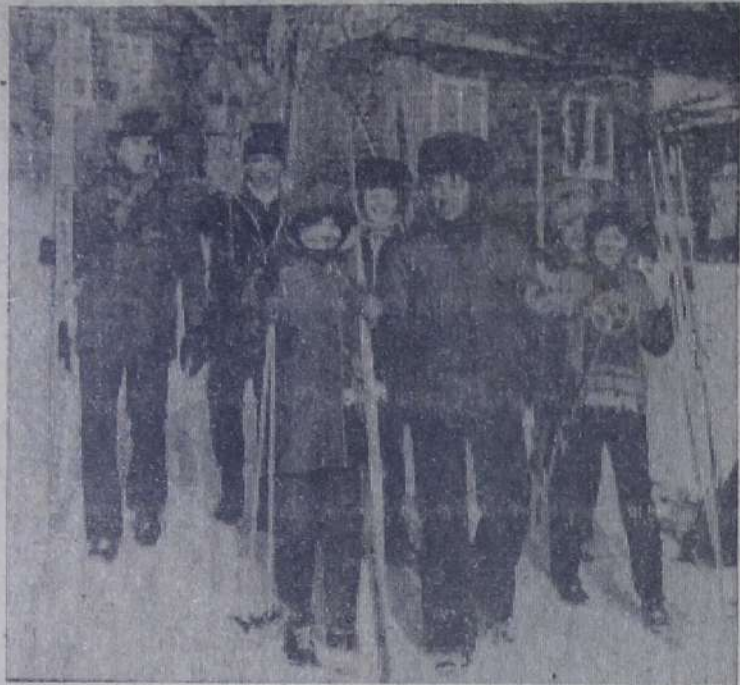
На химическом заводе проводится большая работа по вовлечению труженников предприятия в спортивные секции. В выходные дни на лыжной базе «Корд», где тренируются спортсмены химзавода, всегда дарит оживление. Здесь ведется подготовка к сдаче норм ГТО. На снимке: работники СКЦ-3 в один из выходных дней прибыли на базу для сдачи норм ГТО.