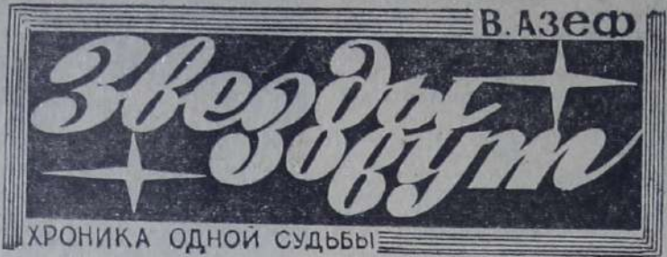
ХРОНИКА ОДНОЙ СУДЬБЫ

«Его картины неповторимы. Многие любители живописи побывавшие на выставках Голобокова, убежденно пишут о том, что его произведениям судя по долгая жизнь. Так считают».