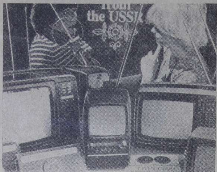
Литовская ССР. Широкую известность коллективу каунасского радиозавода принесли выпускаемые здесь малогабаритные цветные и черно-белые телевизоры «Шилаялис». Они демонстрировались на крупнейших международных выставках, охотно покупаются в зарубежных странах.

Недавно новый, хорошо оснащенный цех получили сборщики цветных «Шилаялисов». К выпуску в будущем году заводские конструкторы подготовили две модели цветных и две — черно-белых «Шилаялисов».