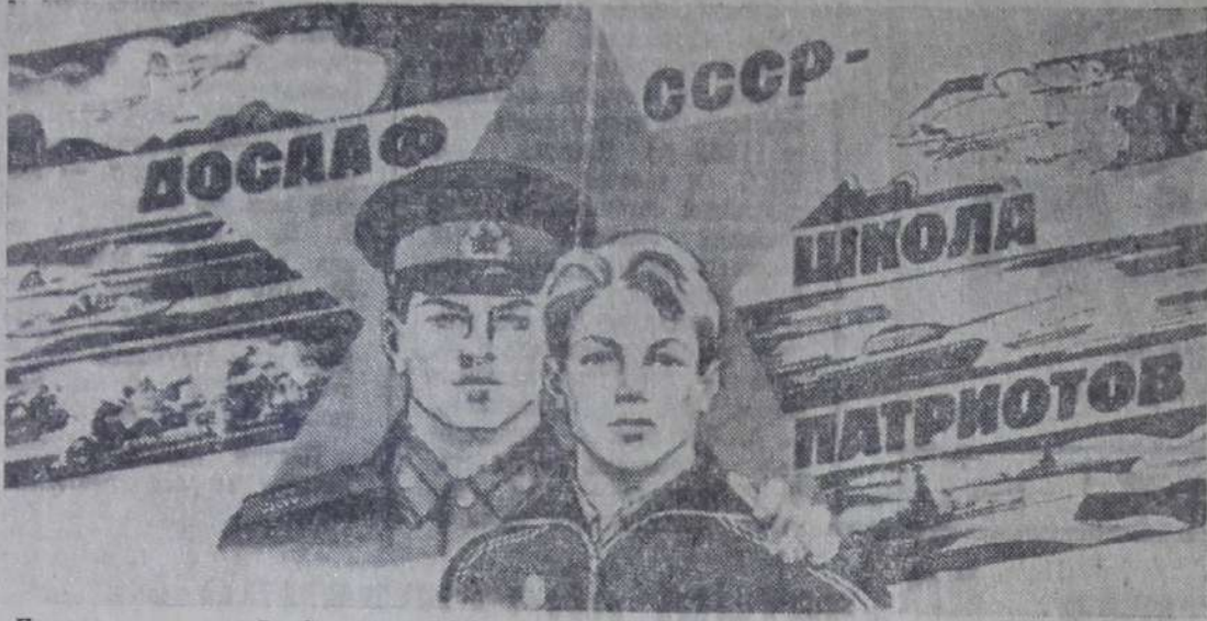
Плакат художника В. Сачкова «ДОСААФ СССР — школа патриотов».