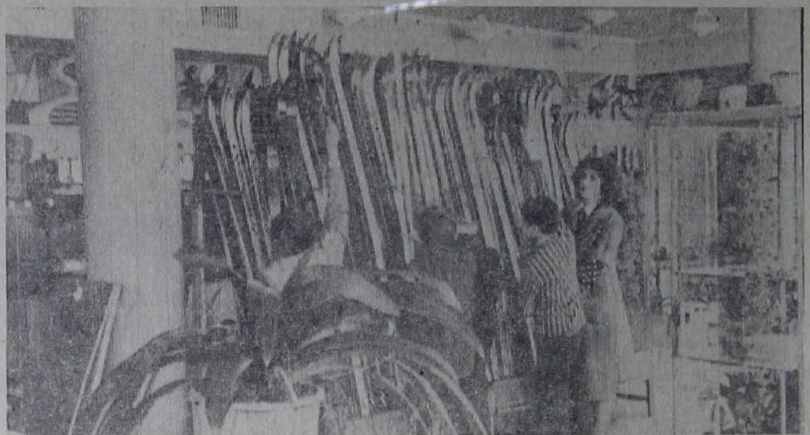
Коллектив магазина спорттоваров и туризма № 15 городского торгового центра хорошо подготовился к зимнему сезону: на прилавках спортивной секции

в большом выборе лыжи, принадлежности для игры в хоккей и другие товары. НА СНИМКЕ: в спортивной секции.