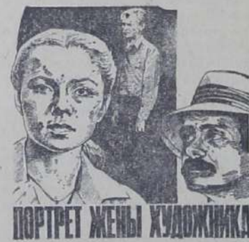
ПОРТРЕТ ЖЕНЫ ХУДОЖНИКА