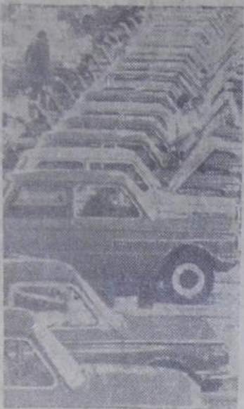
Каждые полторы минуты со сборочного конвейера завода «Коммунар» производственного объединения «АвтоАЗ» в Запорожье сходит автомобиль «Запорожец 968 М». В честь 60-летия образования СССР коллектив завода взял обязательство выпустить сверх плана 200 автомашин.