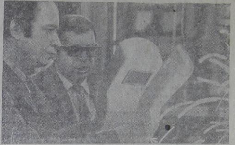
Весомый вклад в строительство газопровода Уренгой — Помар — Ужгород вносит коллектив Всесоюзного научно-исследовательского института по строительству магистральных трубопроводов.

Коллектив института разработал и успешно внедрил сварочный комплекс «Стык-1». На этих комплексах впервые в мировой практике была осуществлена новая технология сварки, которая позволила увеличить производительность труда в четыре раза.