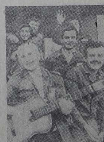
Стоящий вета называет прокладку Балашова-Мур

ской магистрали, с которой связано преобразование и хозяйственное освоение обширных районов Сибири и Дальнего Востока.