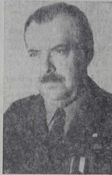
сердечный привет из города Трнавы, из города, который

ваши отцы 37 лет назад, 1 апреля 1945 года, освободили от фашистского ярма. Из материалов вы узнаете, как началось Словацкое национальное восстание, как воевал наш народ против фашистских захватчиков...».