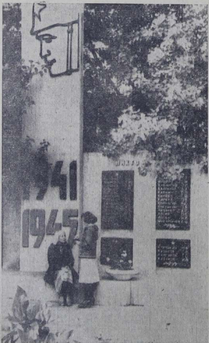
Никто не забыт.

30 сентября. Заключительный концерт. (Большой зал. Начало в 19-30).