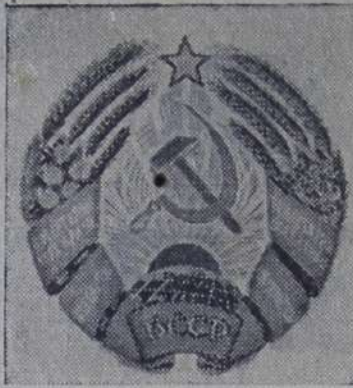
Герб Белорусской ССР.

Минск — столица Белорусской ССР (снимок внизу).