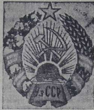
Герб Узбекской ССР.