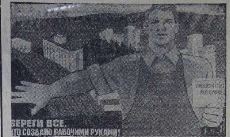
Плакат художника И. Коминарца «Береги все, что создано рабочими руками!». Издательство «Плакат».

Сегодня на японской территории расположены 120 баз и других военных объектов Пентагона, где расквартированы 46 тысяч американских солдат и офицеров. Под прикрытием японо-американского «договора безопасности» американский империализм превратил Японию в форпост вооруженных сил США на Дальнем Востоке и в бассейне Тихого океана. Ежегодно из карманов японских налогоплательщиков изымается миллиард долларов на содержание американских оккупантов — «защитников» Японии от выдуманной «советской военной угрозы». Миролюбивая общественность,