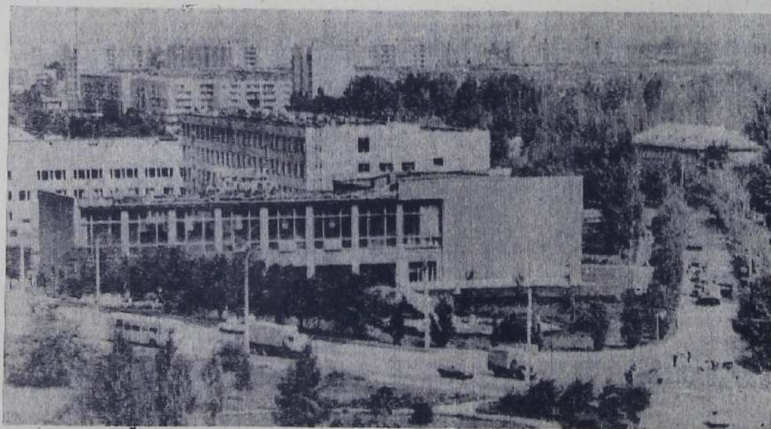
Город родной. На переднем плане — здание спортивно-комплекса «Буревестник» филиала политтехнического института.

ТРЕБУЮТСЯ МОНТИРОВЩИКИ СЦЕНЫ. За справками обращаться во Дворец культуры строителей по телефону 4-56-01.