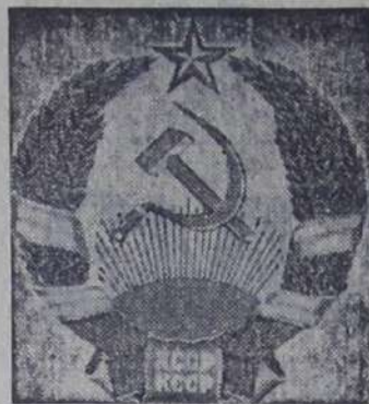
Герб Казахской ССР.

25 августа проведено собрание, где было указано жильцам на недопустимость подобных фактов.