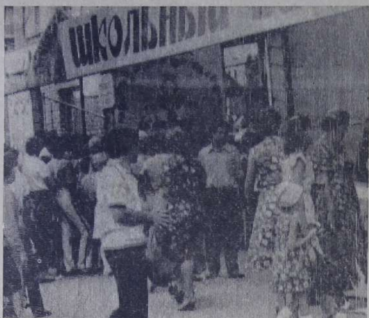
С приближением нового учебного года торгующие организации устраивают традиционные школьные базары. На снимке: школьный базар в островной части города.