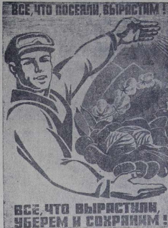
Плакат художника С. Жмурен- кова. Изда- тельство «Плаката».

Л. ЧУРИНА, старший товаровед объединения № 6.