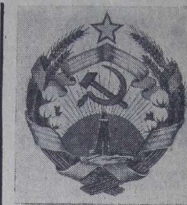
Герб Азербайджанской ССР.