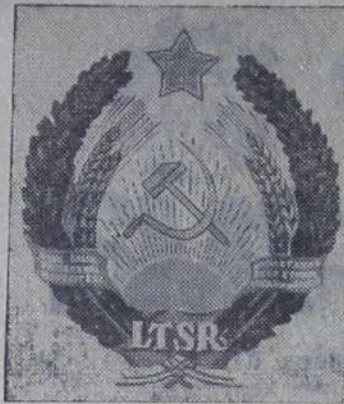
Герб Литовской ССР.