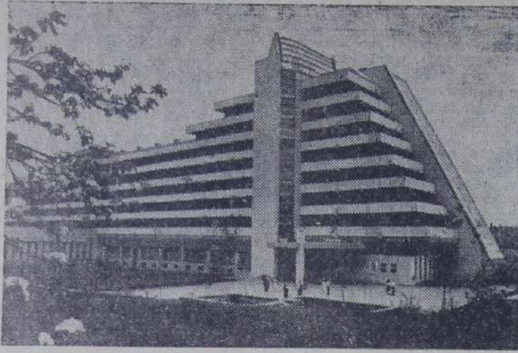
Львовская область. Выше 250 тысяч человек примет в нынешнем году по профсоюзным путевкам известный бальнеологический курорт Трускавец.

Корпуса здравниц расположены на живописных холмах. Рядом с ними бьюты знаменитой минеральной воды «Нафтуся», водо-озо-керитолечебница, поликлиника.