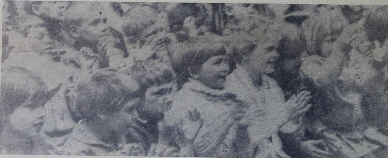
Фото и текст М. БАБЕНКО.

На снимках: идет конкурс «А ну-ка, мальчишки!», который проводит пионервожатая Г. А. Тесленко; ребята в восторге!