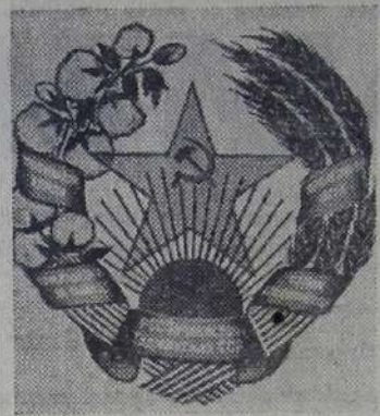
Герб Таджикской ССР.