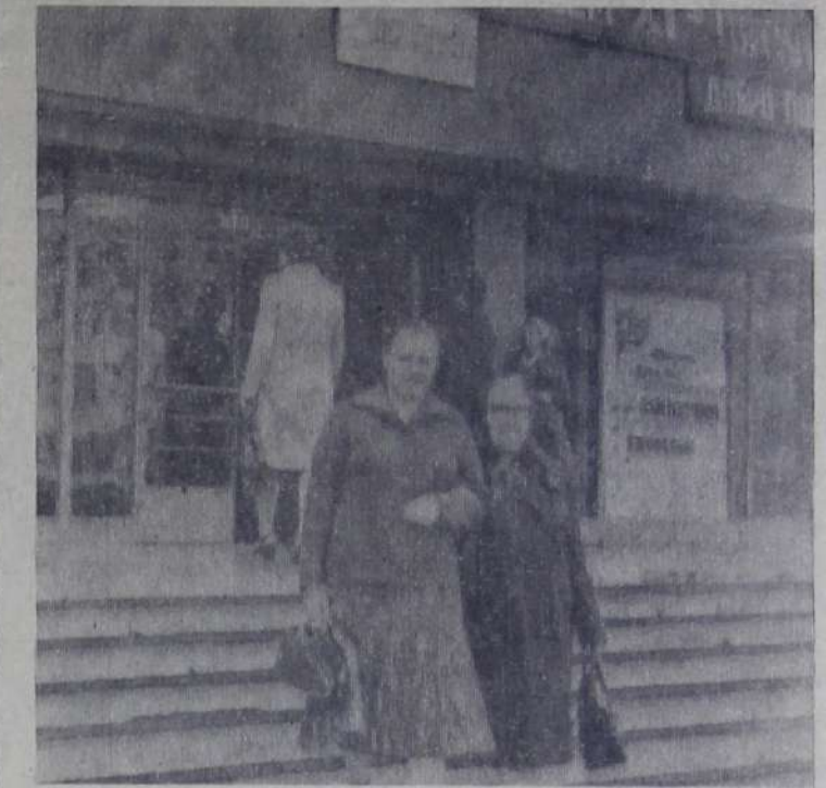
Активно прошло голосование на избирательном участке № 15, расположенном в здании Дворца культуры строителей.

А нас, в свою очередь, порадовала высокая организованность выборов, радужные улыбки встречающих, обилие цветов. Все это подчеркивает праздничность события, создает у людей хороший настрой. Еще одна отрадная деталь — молодым избирателям, голосующим впервые, дарят цветы. Получил свой билет и Дима