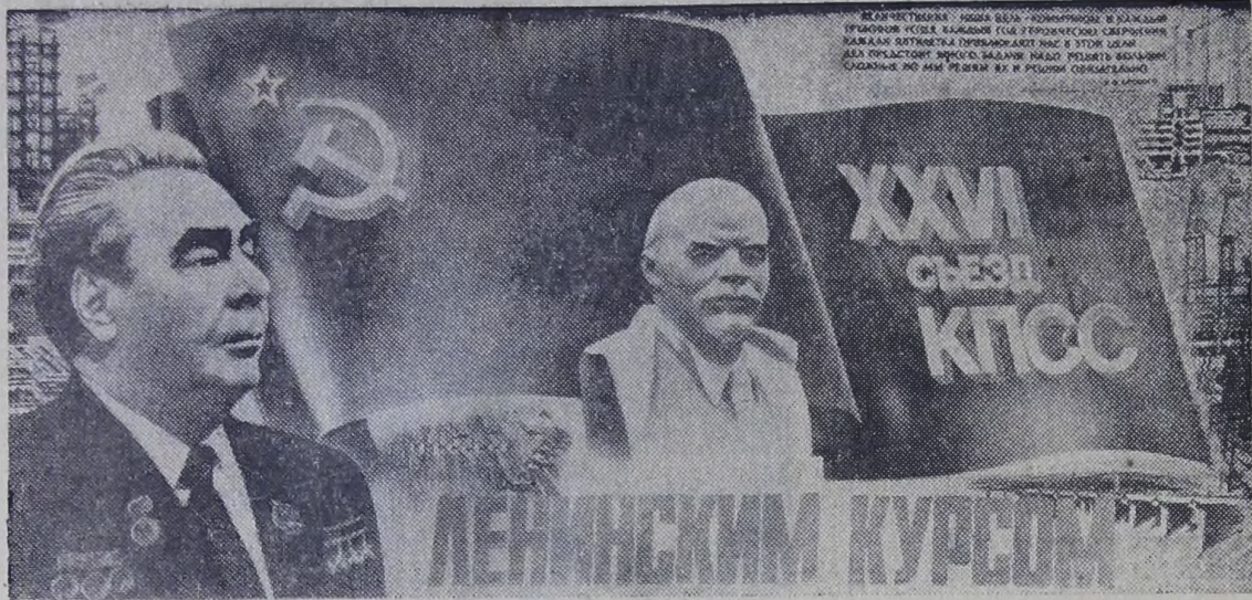
Плакат художника В. Арсенкова.