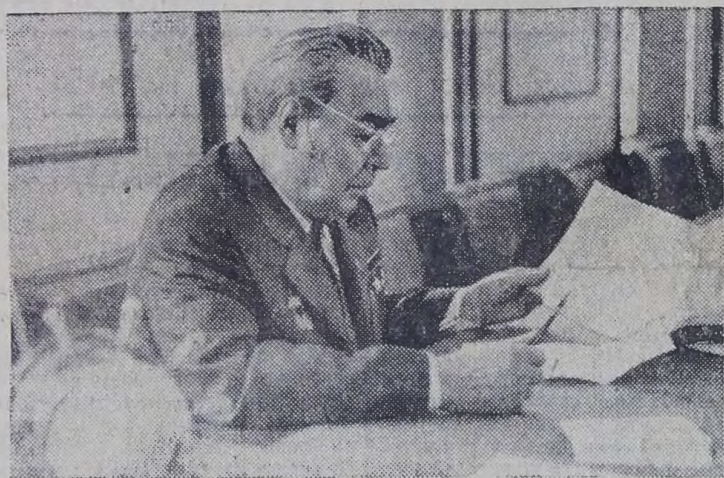
Генеральный секретарь ЦК КПСС, Председатель Президиума Верховного Совета СССР Леонид Ильич Брежнев в рабочем кабинете.

На снимке: Л. И. Брежнев на «Запорожстали». Леонид Ильич внимал в мельчайшие подробности восстановления металлургического гиганта.