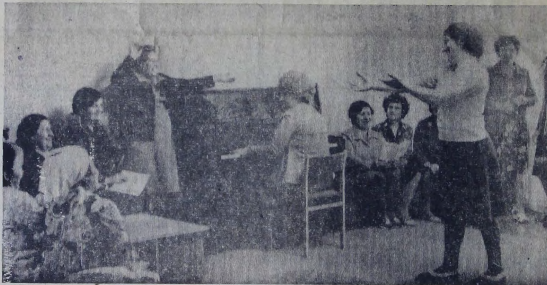
Отлично отдыхают работники управления «Саратовгэстрой» в своем профилактории. Здесь они проходят курс лечения, поправляют здоровье. А по вечерам все собираются в уютных холлах. Звучат музыка, шутки, смех. НА СНИМКЕ: в одном из холлов здравницы.

Бюро по трудоустройству и информации населения (ул. Комсомольская, 35, кв. 1, телефон 4-05-42)