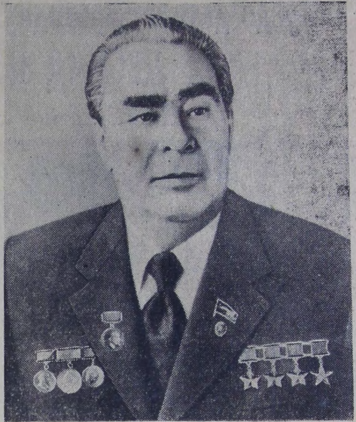
Генеральный секретарь ЦК КПСС, Председатель Президиума Верховного Совета СССР Леонид Ильич Брежнев.

19 декабря — 75 лет со дня рождения товарища Леонида Ильича Брежнева