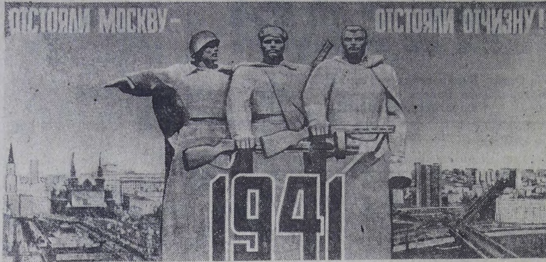
Плакат художника В. Арсенова. Издательство «Плакат».

Наступление немецко-фашистских войск захлебнулось у порога столицы. 5—6 декабря советские войска перешли в решительное контрнаступление, закончившееся изгнанием врага из пределов Московской и ряда других областей.