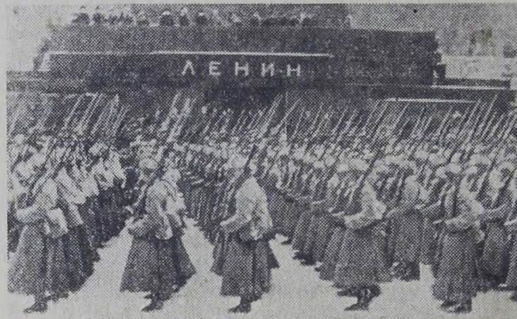
Предвестником грядущей победы стал незабываемый парад Красной Армии в суровый день 24-й годовщины Октября. Парад негибкого мужества. Парад-легенда. Золотой строкой записан он в историю Родины, отстаивающей мир на земле.

На снимке: парад на Красной площади 7 ноября 1941 года.