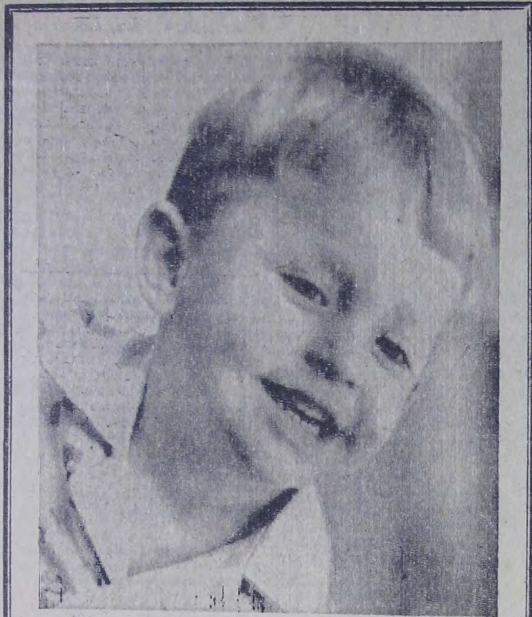
Фотоконкурс «Огней коммунизма»