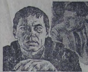
ОХОТА НА ЛИС

Репертуар сентября отличает жаровое разнообразие, наличие фильмов для зрителей самого разного возраста и художественных вкусов. «Охота на лис» — так называется новая картина киностудии «Мосфильм». Это третья совместная работа сценариста А. Миндадзе и режиссера В. Абдраштова. Счастливы наши дни, когда молодые художники — единомышленники, как и в первых двух своих фильмах «Слово для защиты» и «Поворот», обращаются к теме жизненных перекрестков, на которых человек, шедший по жизни удобной и привычной дорогой, должен заново решать, куда идти, для того чтобы остаться или стать человеком в самом высоком нравственном и гражданском значении этого слова. «Охота на лис», как и прежние работы этих авторов, — судебная история. Мальчишка — хулиган в темной аллее жестоко избил незнакомого человека. Как должен относиться этот ни за что пострадавший человек к своему обидчику? Кажется, ответ однозначен. Но вот ситуация для размышлений: потерпевший энергично добивается освобождения осужденного преступника. В чем дело? Может быть, вскрылись новые обстоятельства? Нет, парень наказан по заслугам. Новые обстоятельства «потерпевший» нашел в своей душе. Что из этого вышло? Как сложились их отношения, как каждый из них изменил другого, вы узнаете,