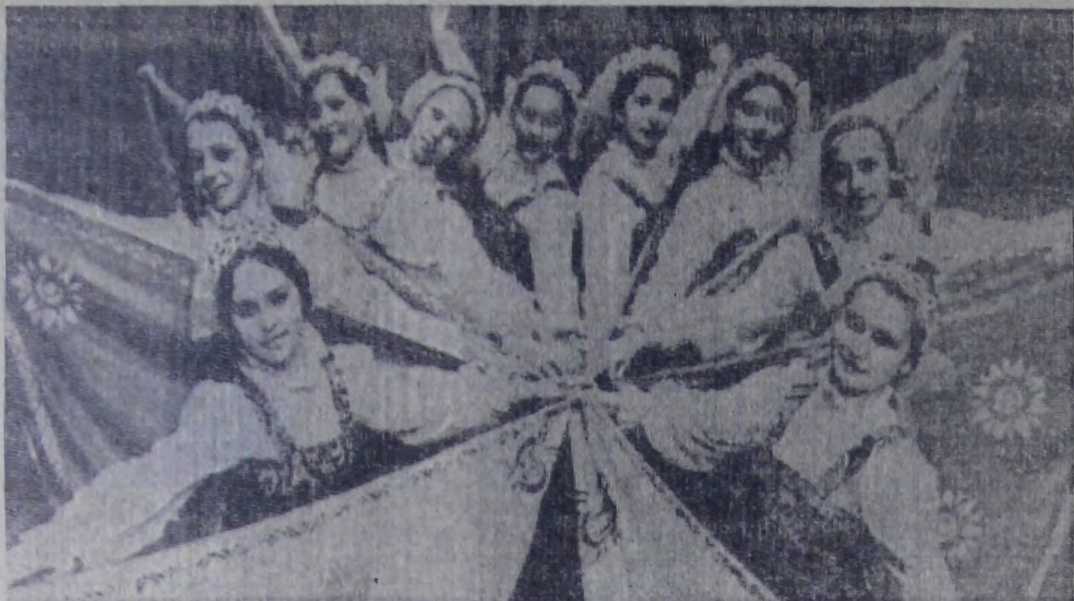
28 кружков художественной самодеятельности, объединяющие около тысячи участников, работает во Дворце культуры строителей. Большой популярностью пользуются театральный коллектив, вокально-инструментальный ансамбль «Молодые голоса», танцевальный коллектив и другие.