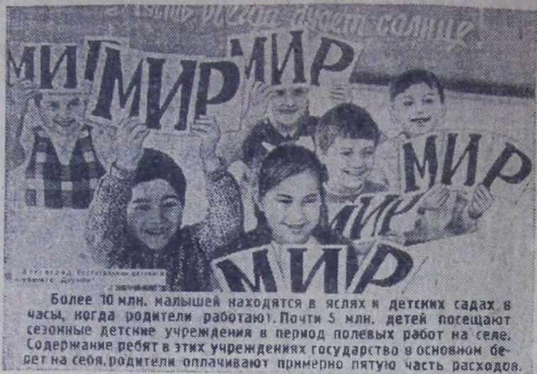
Более 10 млн. малышей находятся в яслях и детских садах в часы, когда родители работают. Почти 5 млн. детей посещают сезонные детские учреждения в период полевых работ на селе. Содержание ребят в этих учреждениях государство в основном берет на себя, родители оплачивают примерно пятую часть расходов.