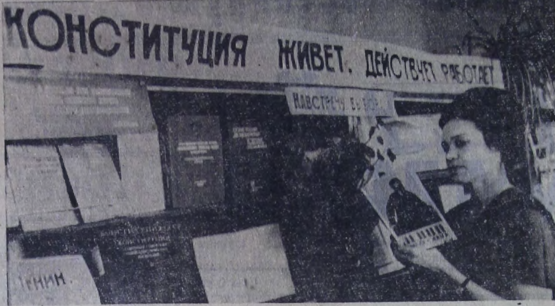
В читальном зале центральной профсоюзной библиотеки Саратогасстроя всегда оживленно. Читатели знакомятся с новинками литературы. Здесь же находится агитпункт избирательного участка № 21.