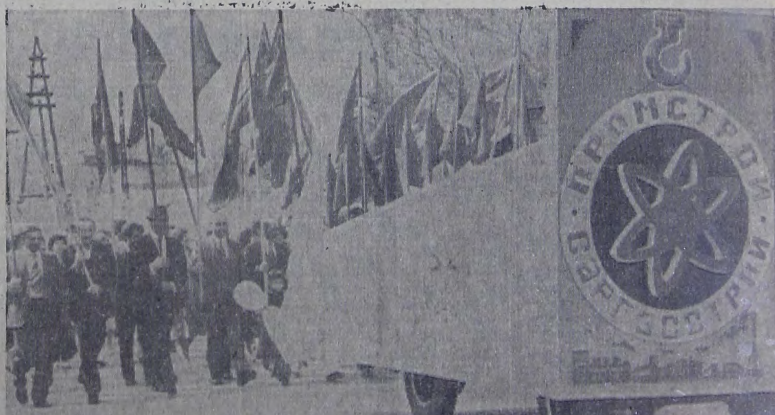
Праздничная демонстрация трудящихся 1 Мая.

Первомайские демонстрации прошли по всей Советской стране. Они показали решимость советских людей успешно завершить задания 1980 года и пятилетки в целом, выполнить программу, намеченную XXV съездом КПСС, ознаменовать новыми трудовыми свершениями предстоящий XXVI съезд нашей партии. Страна Советов уверенно идет к коммунизму.