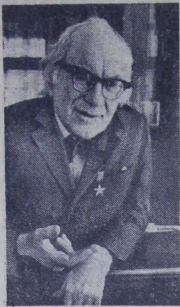
Ленинской премией 1980 года за телевизионные работы последних лет награжден Герой Социалистического

Труда, народный артист СССР, лауреат Государственных премий Игорь Владимирович Ильинский (на снимке).