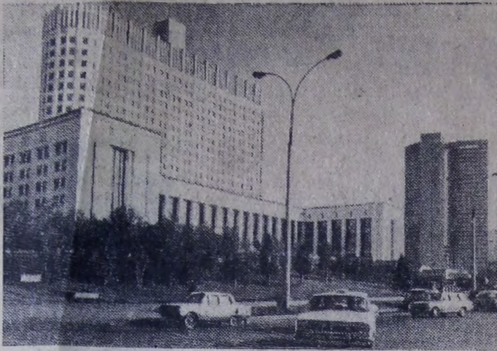
Москва. Вид на Дом Советов РСФСР и здание СЭВ.