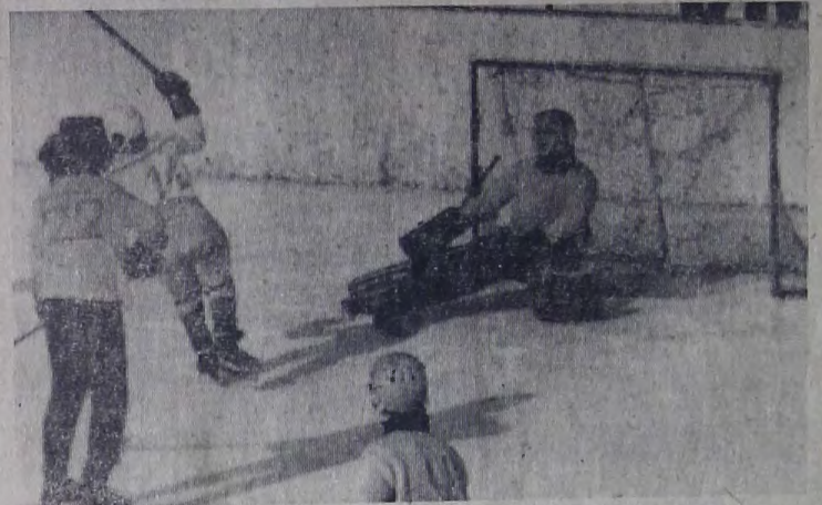
Шайба в воротах!