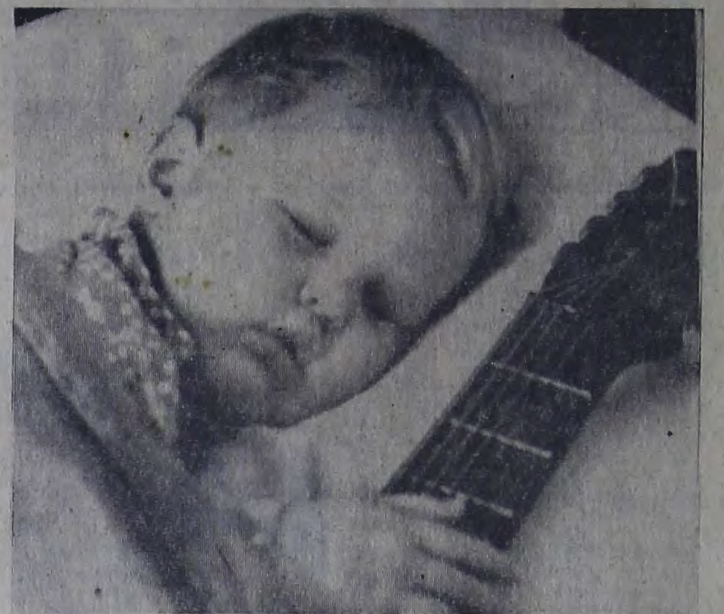
Во мне приходит музыка по мне.