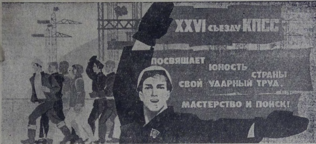
Плакаты художника И. Коминарца. Издательство «Планет».