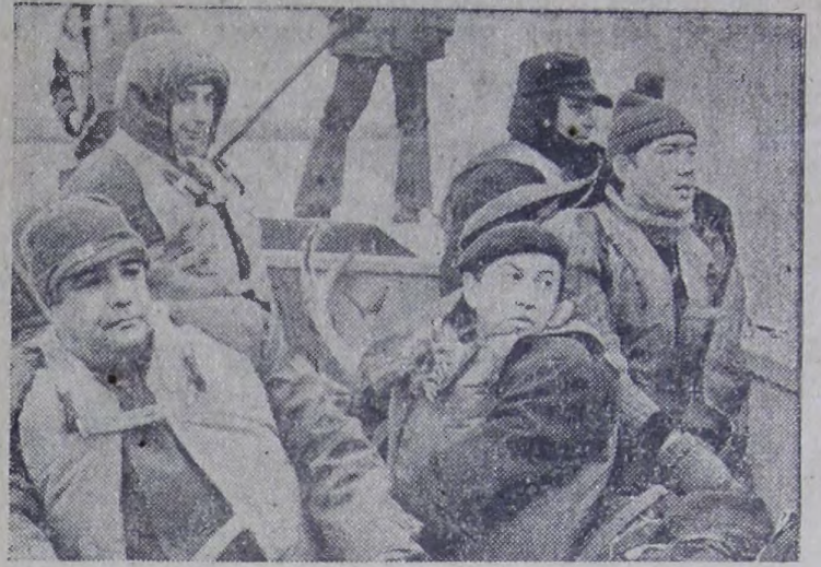
На трассе Северного морского пути работает Экономическая экспедиция Сибирского отделения Академии наук СССР.