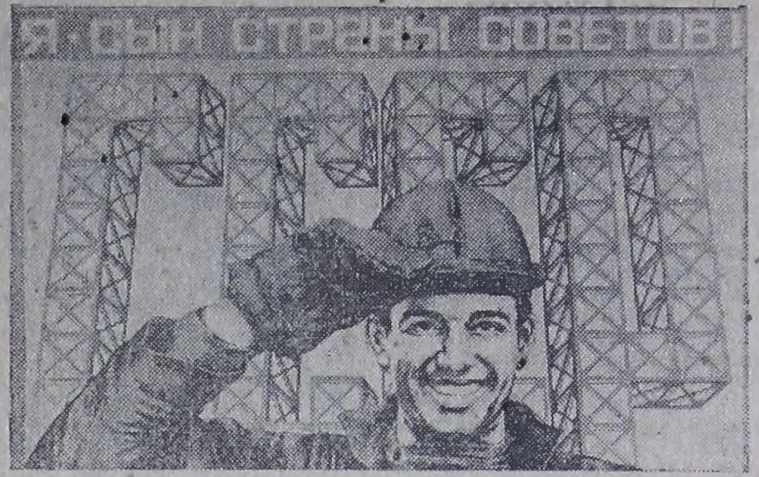
Планат художника В. Феклева. Издательство «Планат».