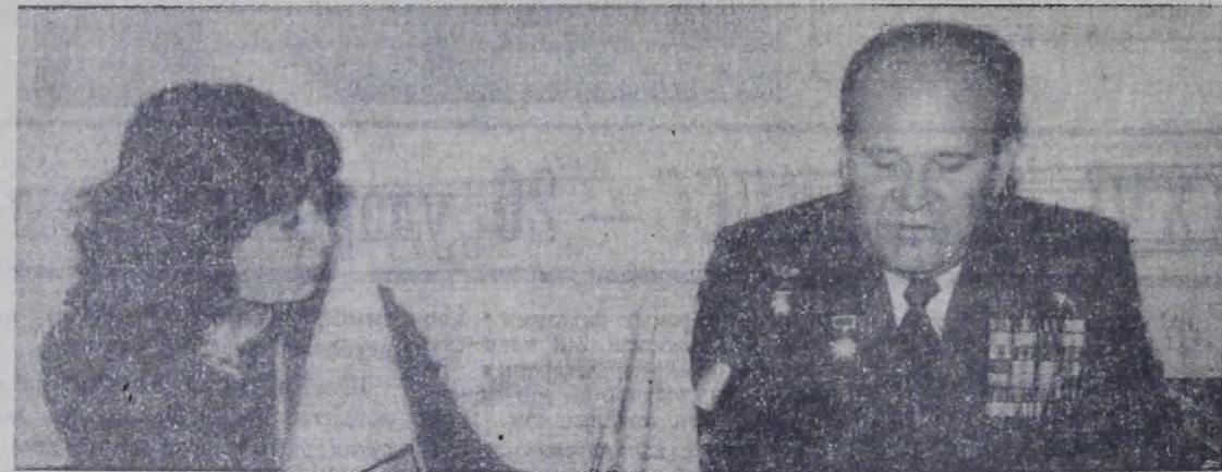
Братская дружба связывает трудящихся Балашова и Трнавского района ЧССР.