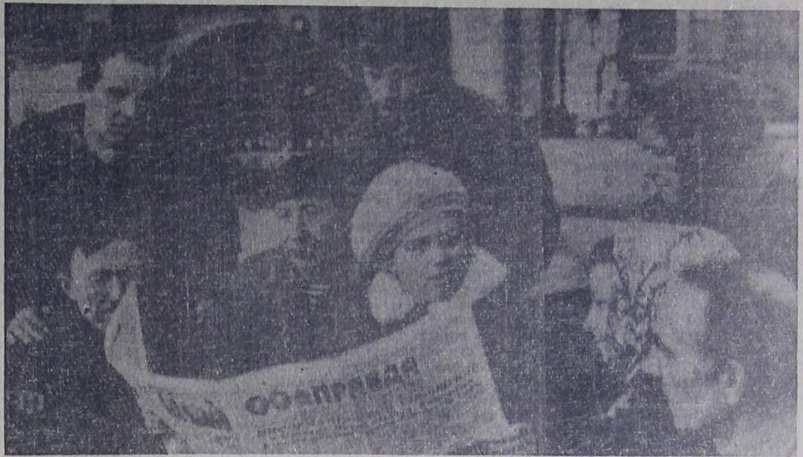
В коллективах пехов и участков судоремонтного завода с огромным интересом изучают материалы ноябрьского Пленума ЦК КПСС и сессии Верховного Совета СССР.

После съезда состоялся тематический вечер «Наша биография», подготовленный участниками художественной самодеятельности Дворца культуры строителей.