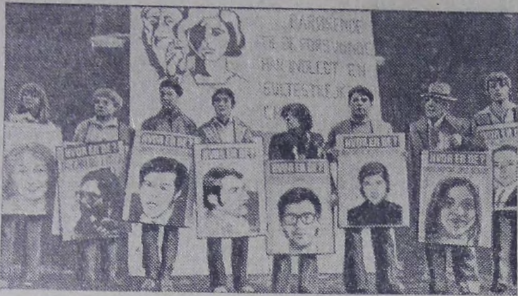
Преступления, чинимые фашистской кликой Пиночета в Чили, вызывают возмущение всех честных людей планеты. На снимке: во время демонстрации проживающих в Дании чилийских эмигрантов. Они выразили решительный протест против злодейских хунты, повлекших за собой бесследное исчезновение сотен тысяч их соотечественников.